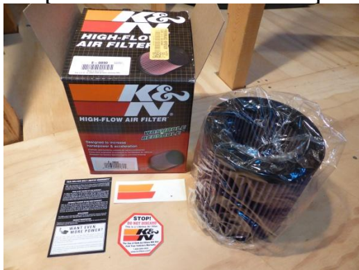
# N19 FILTRE à AIR PERMANENT ['HIGH-FLOW' K&N #E-0890]