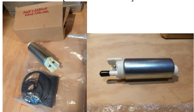
# N20 POMPE à ESSENCE – 1985-88 V6 [SPARTA #PN2001]