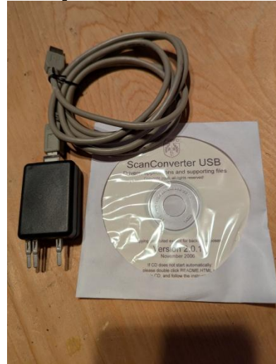
# N18 SCAN TOOL [CD + CÂBLE + CONNECTEUR]