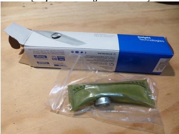
# N21 FILTRE de POMPE à ESSENCE 1984-88 [Tamis] [Delphi Technologies #BFS0001]